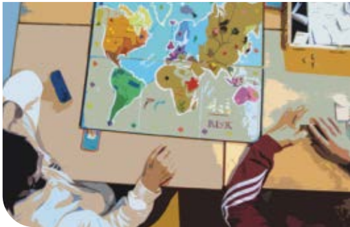
ECONOMIE EN ORGANISATIE

Grondig uitproberen wat later mogelijk je definitieve studierichting kan zijn.