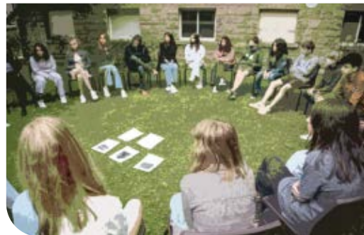
MAATSCHAPPIJ EN WELZIJN