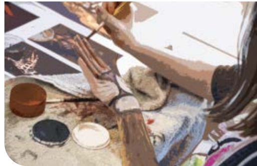
KUNST EN CREATIE