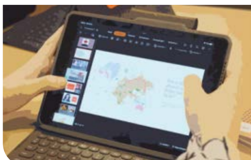
MAATSCHAPPIJ EN WELZIJN

Grondig uitproberen wat later mogelijk je definitieve studierichting kan zijn.