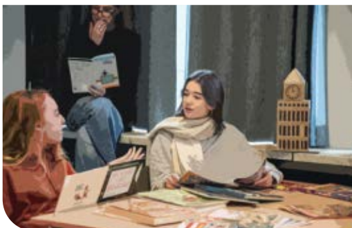
MODERNE TALEN EN WETENSCHAPPEN